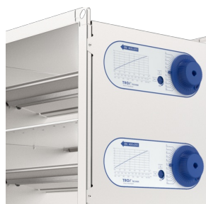
JEDNOSTKA Z PODWÓJNYM REGULATOREM